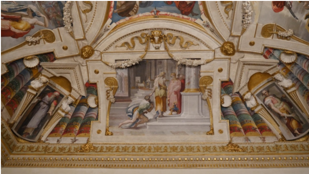
104. Pellegrino Tibaldi, 1550-1551, Bologna, palazzo Poggi, sala di Ulisse, part.