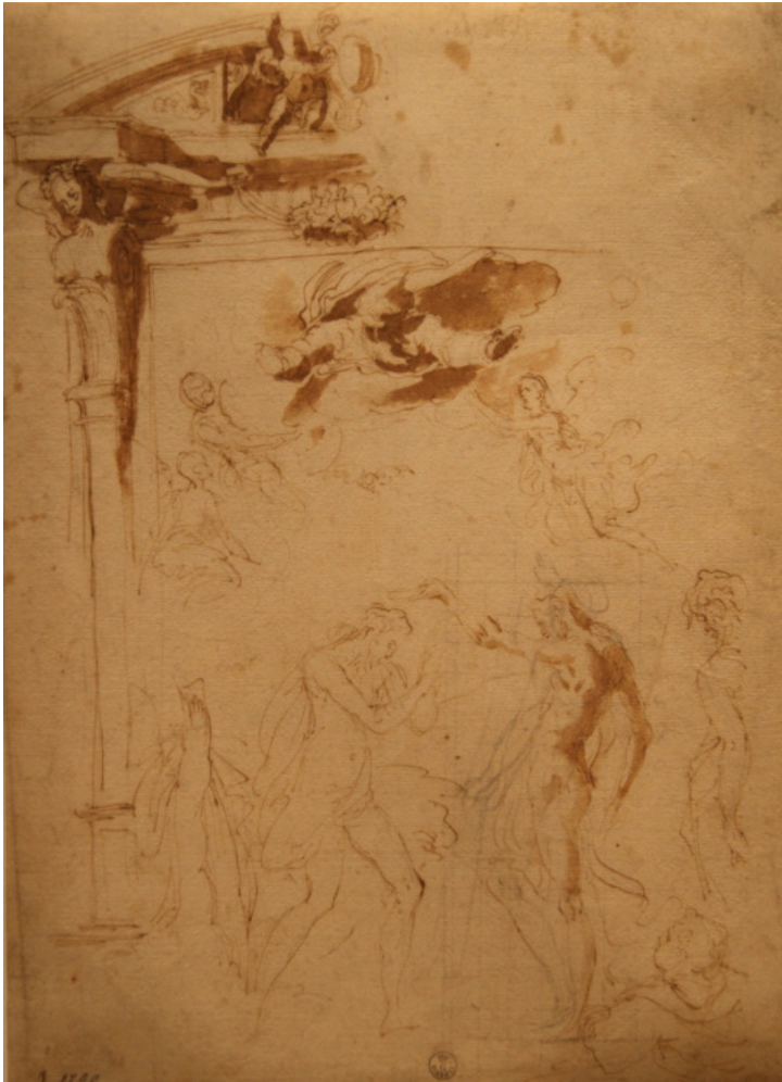
109. Pellegrino Tibaldi, Progetto per altare con Battesimo di Cristo , 1554 ca., Firenze, Gabinetto dei Disegni e delle Stampe degli Uffizi, 1790 O