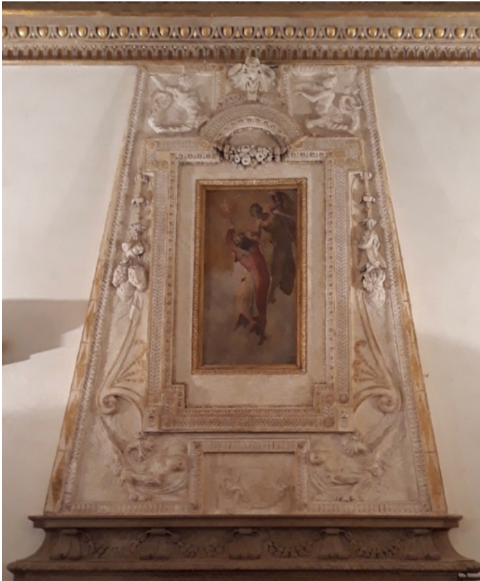
107. Pellegrino Tibaldi, camino in stucco, 1550-1551, Bologna, palazzo Poggi, sala di Ulisse