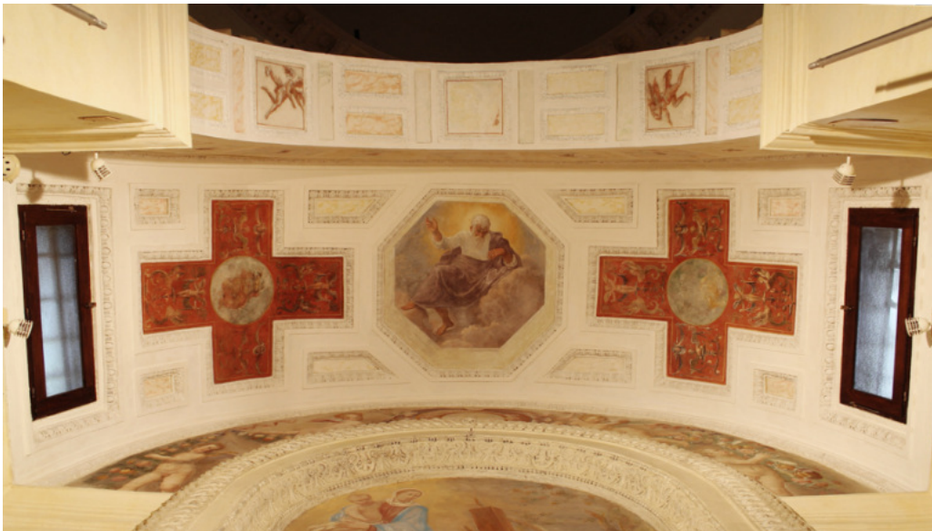
108. Roma, chiesa di Sant'Andrea sulla Via Flaminia, volta absidale e sottarco, 1553