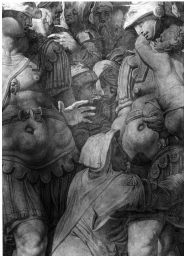
114. Pellegrino Tibaldi, La famiglia di Dario davanti ad Alessandro , 1545-1547, Roma, Castel Sant'Angelo, sala Paolina, part.