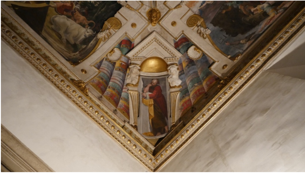
105. Pellegrino Tibaldi, 1550-1551, Bologna, palazzo Poggi, sala di Ulisse, part.