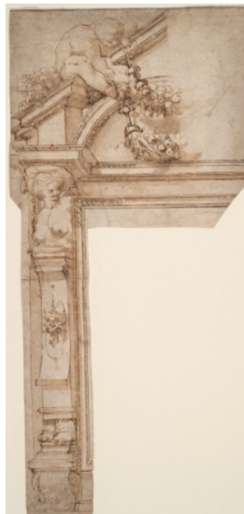
110. Pellegrino Tibaldi, Progetto per altare , 1554 ca., Harvard, Fogg Art Museum, inv. 1932.250