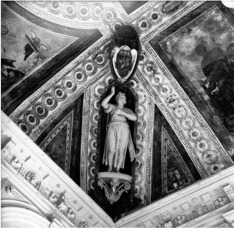
111. Pellegrino Tibaldi, Speranza , 1558-1560, Ancona, Loggia dei Mercanti