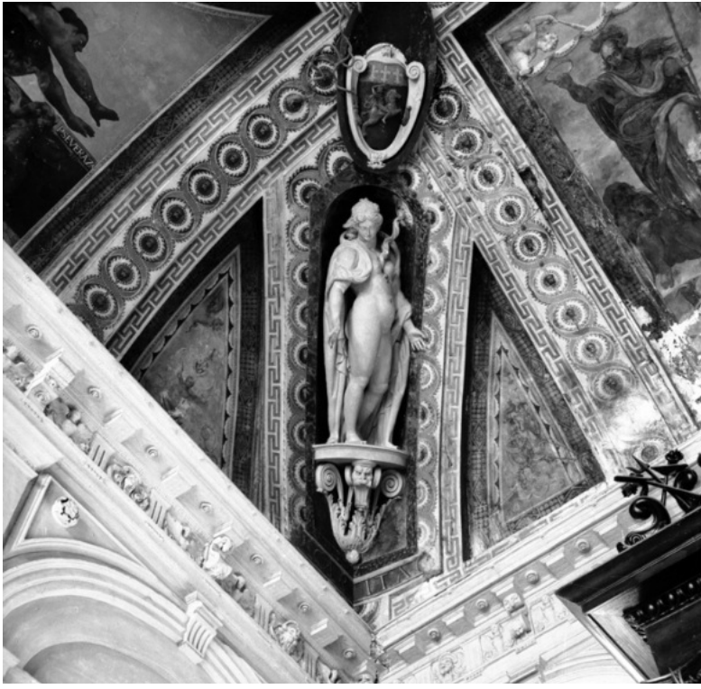
113. Pellegrino Tibaldi, Carità , 1558-1560, Ancona, Loggia dei Mercanti