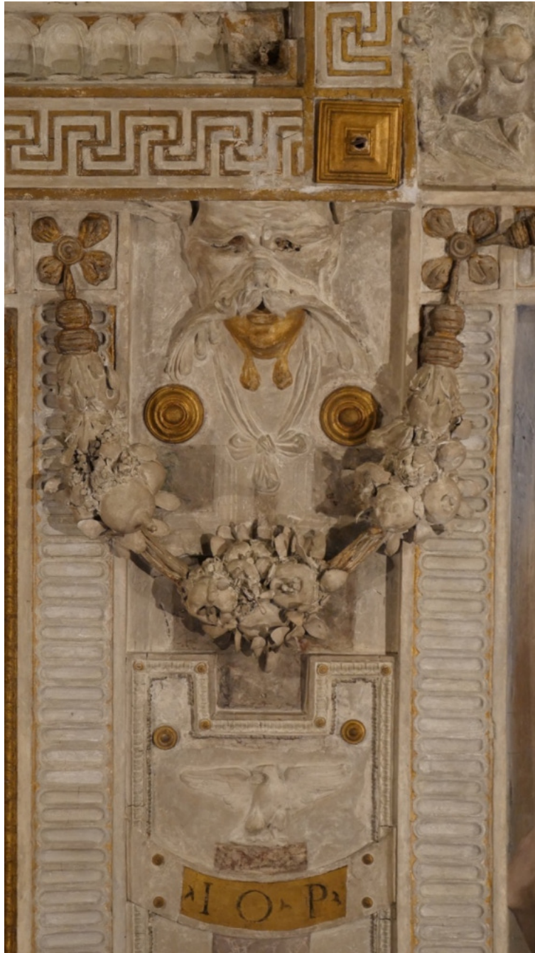
102. Pellegrino Tibaldi, Mascherone , 1550-1551, Bologna, palazzo Poggi, sala di Polifemo