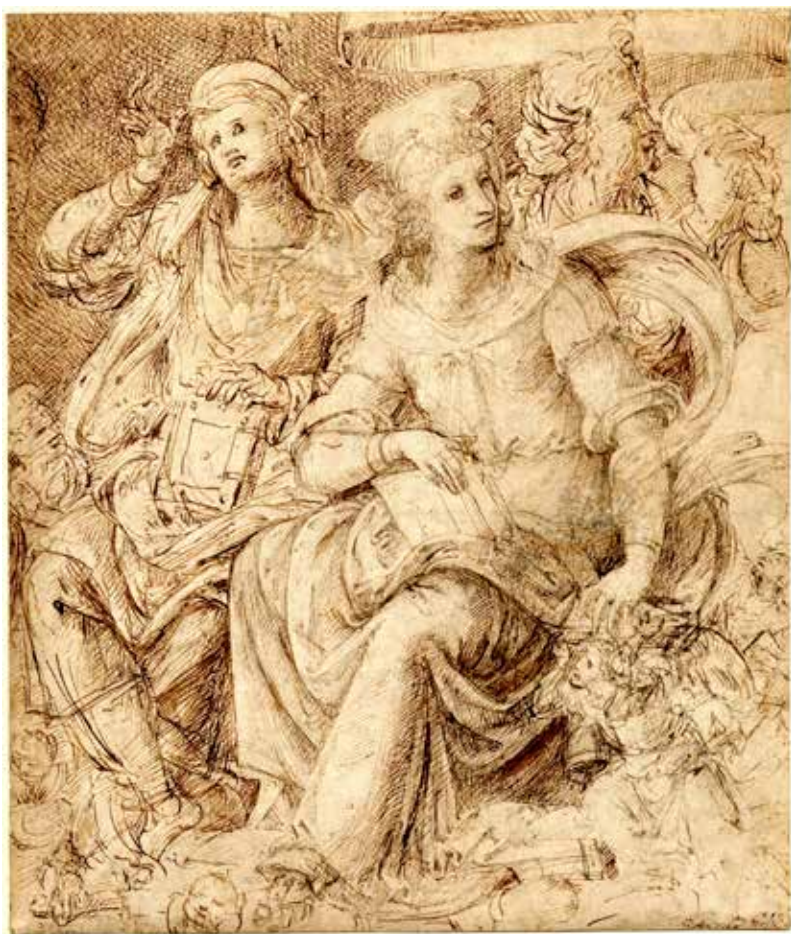
47. Baldassarre Peruzzi, Sibille , Londra, British Museum, Department of Prints and Drawings