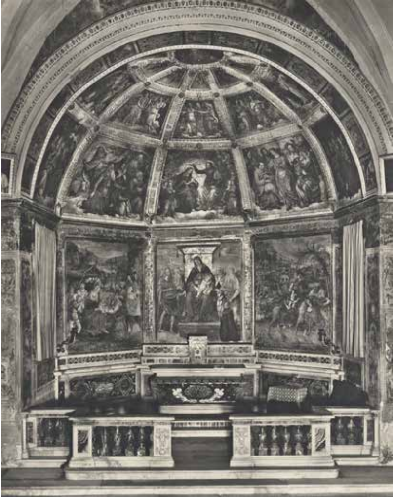
43. Baldassarre Peruzzi e collaboratori, Storie di Maria , Roma, Chiesa di Sant'Onofrio al Gianicolo