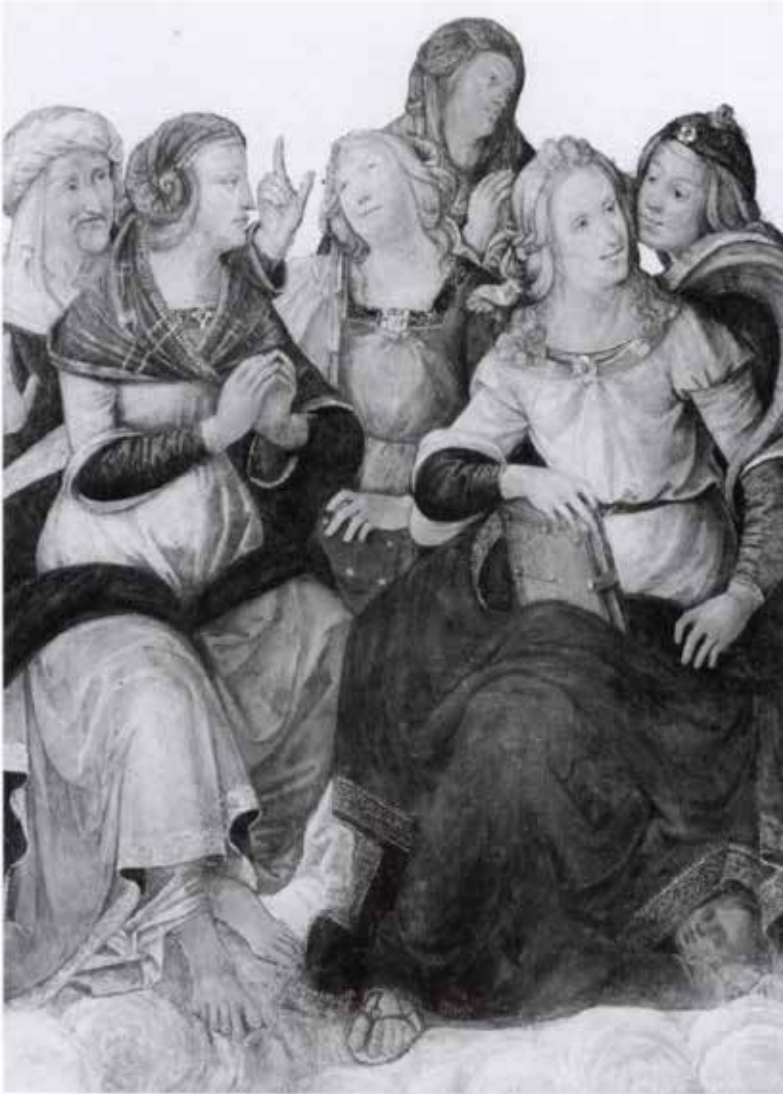
48. Baldassarre Peruzzi e collaboratori (Jacopo Ripanda?), Sibille (part.), Roma, Chiesa di Sant'Onofrio al Gianicolo