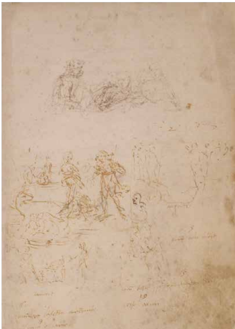
55. Cola dell'Amatrice, Studi con storie di Romolo e Remo , Fermo, Biblioteca Civica "Romolo Spezioli"