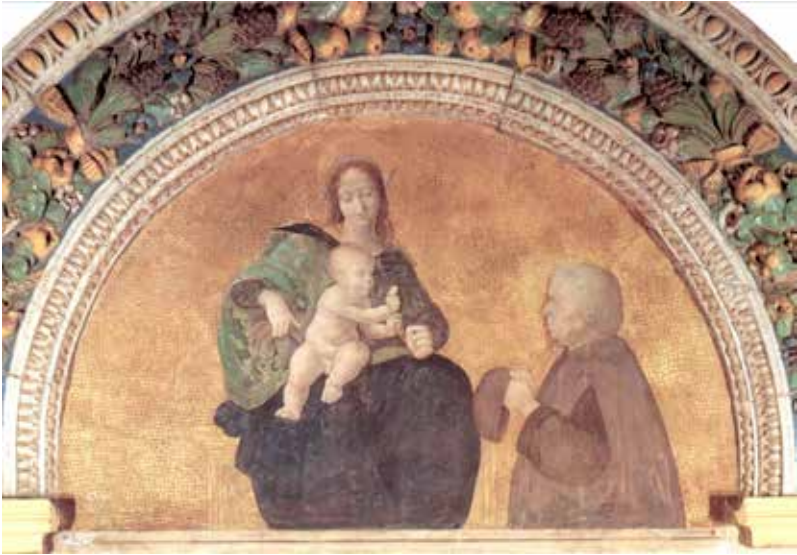
50. Cesare da Sesto, Madonna col Bambino e il donatore , Roma, Chiesa di Sant'Onofrio al Gianicolo