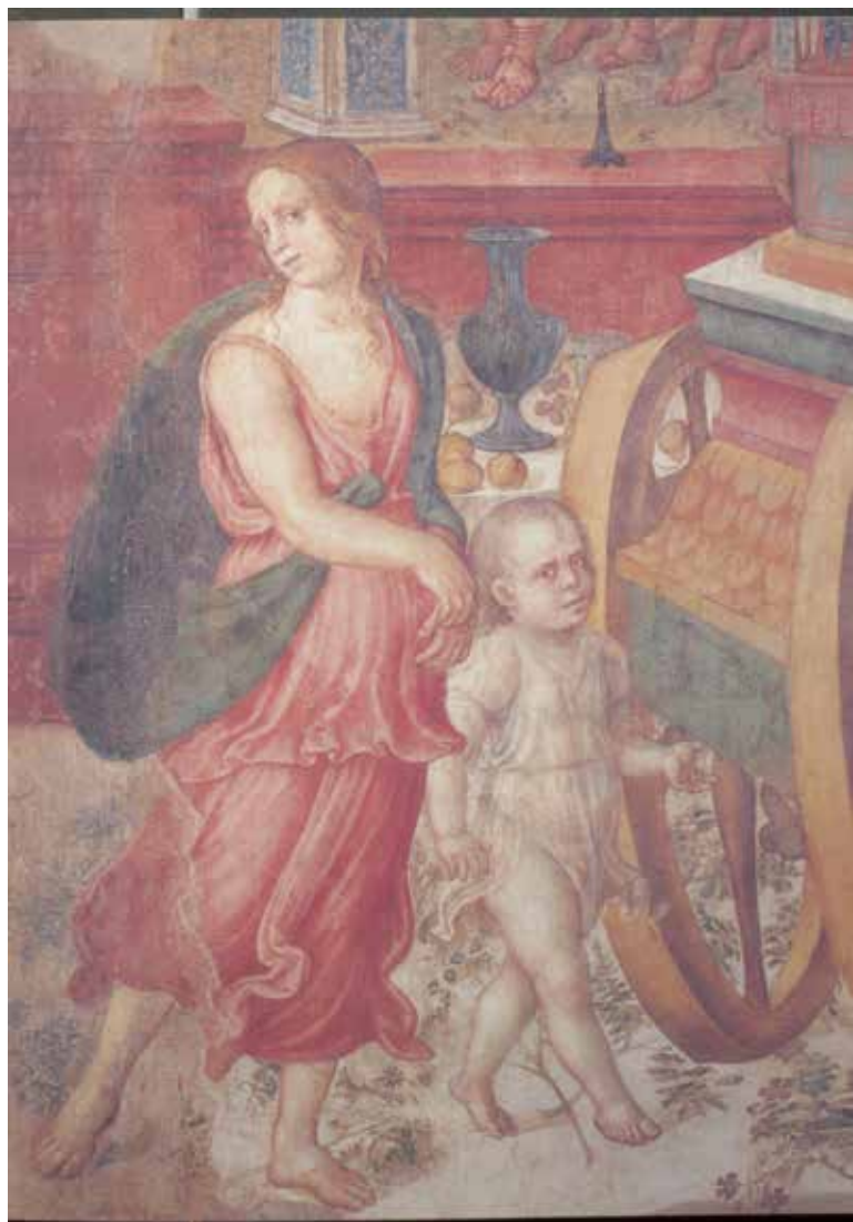
38. Jacopo Ripanda e collaboratori, Trionfo di Emilio Paolo (part.), Roma, Palazzo dei Conservatori, Sala della Lupa