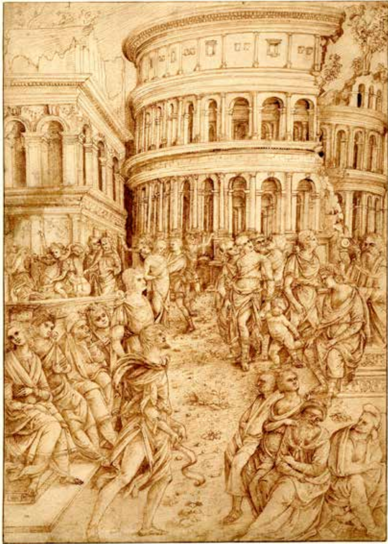
39. Baldassarre Peruzzi o Jacopo Ripanda (?), Studio per storie di Cesare e Traiano , Londra, British Museum, Department of Prints and Drawings