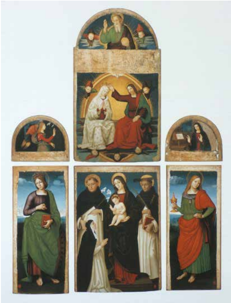
56. Antonio Rimpatta, Polittico Mormile , Firenze, Gallerie degli Uffizi (depositi)