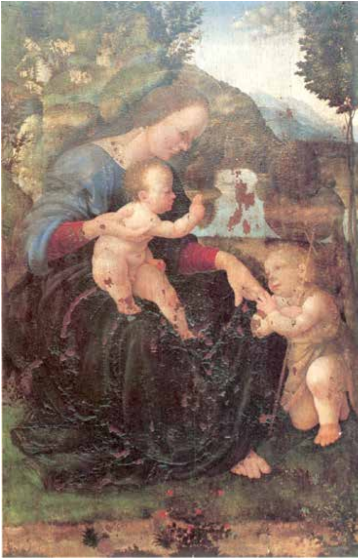
51. Cesare da Sesto, Madonna della Ciliegia , Campagnano Romano, Chiesa di San Giovanni Evangelista