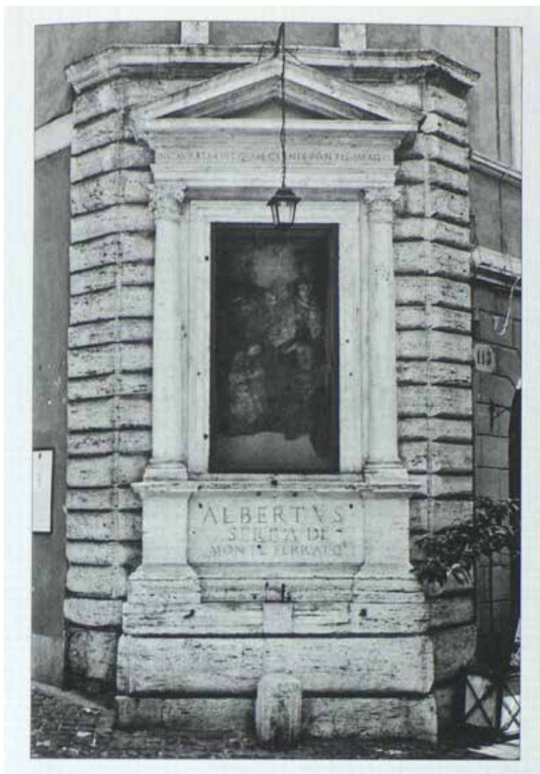
58. Antonio da Sangallo il Giovane e Perino del Vaga, Immagine di Ponte , Roma, angolo tra via dei Coronari e vicolo Domizio