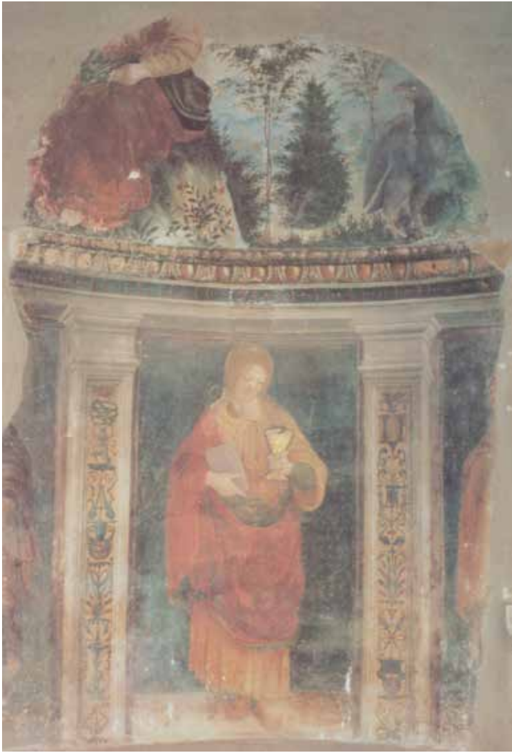
49. Cesare da Sesto, San Giovanni Evangelista , Campagnano Romano, Chiesa di San Giovanni Evangelista