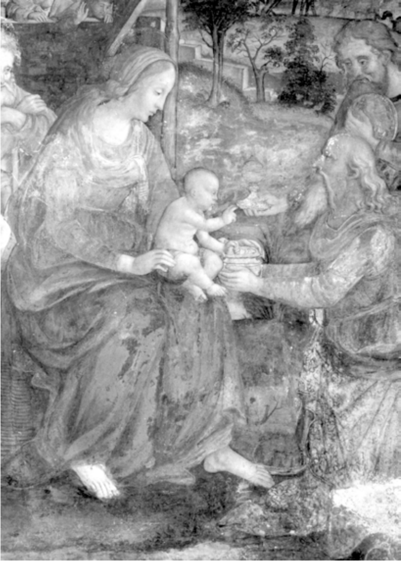
52. Baldassarre Peruzzi e collaboratori (Cesare da Sesto?), Adorazione dei Magi (part.), Roma, Chiesa di Sant'Onofrio al Gianicolo