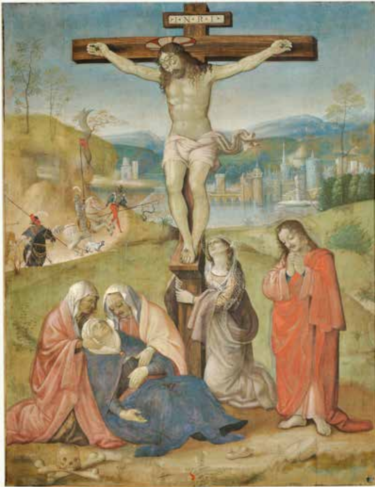
40. Collaboratore di Peruzzi a Sant'Onfrio (Cesare da Sesto?), Crocifissione , Siena, Pinacoteca Nazionale