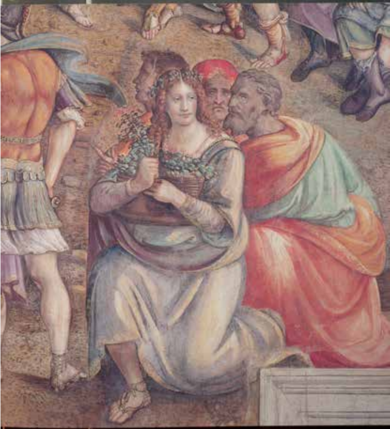
37. Jacopo Ripanda e collaboratori, Trattative di pace tra Lutazio, Catulo e Amilcare (part.), Roma, Palazzo dei Conservatori, Sala delle Guerre Puniche