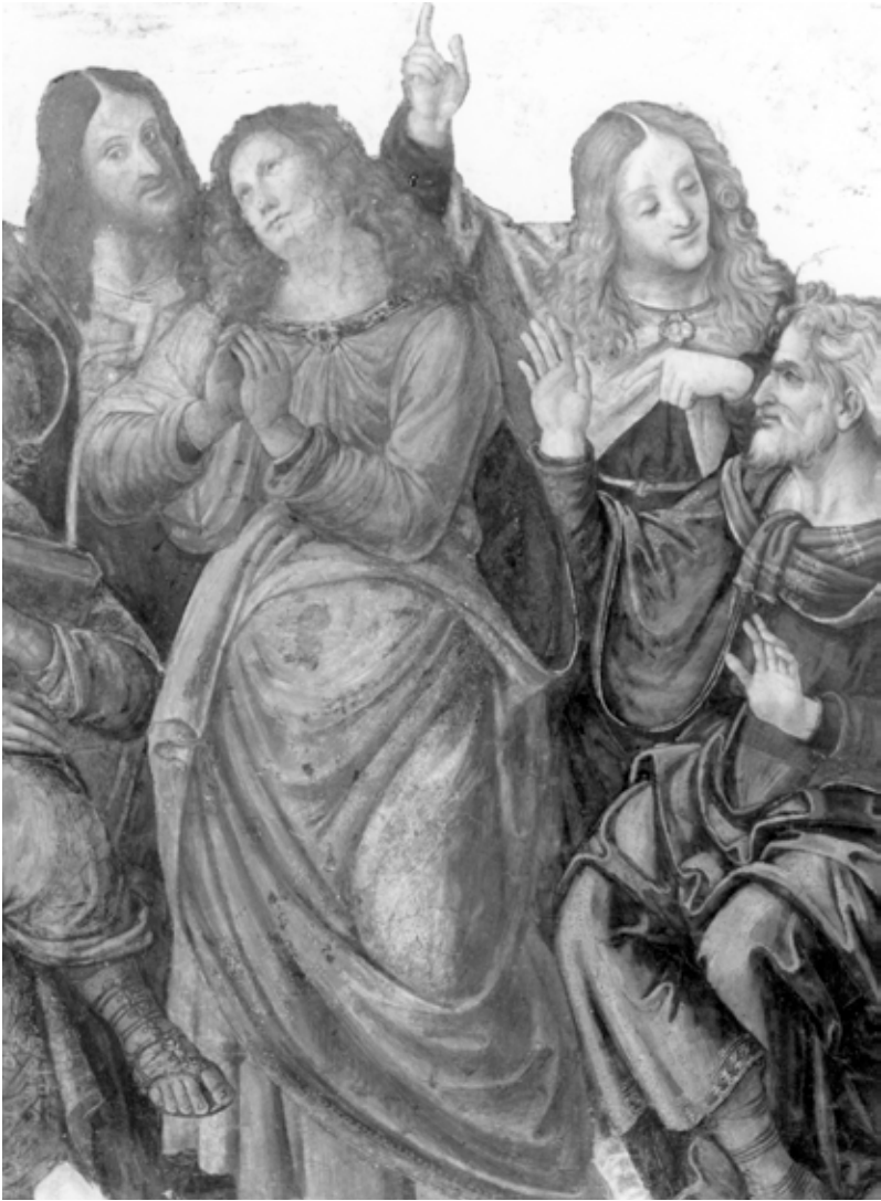
45. Baldassarre Peruzzi e collaboratori, Apostoli (part.), Roma, Chiesa di Sant'Onofrio al Gianicolo