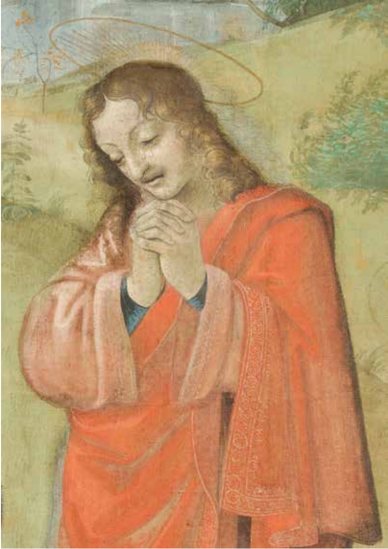
46. Collaboratore di Peruzzi a Sant'Onofrio al Gianicolo (Cesare da Sesto?), Crocifissione (part.), Siena, Pinacoteca Nazionale