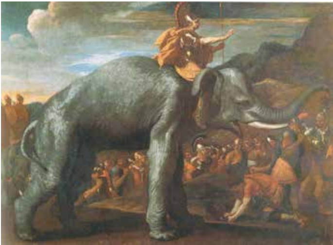
33. Jacopo Ripanda e collaboratori, Annibale in Italia (part.), Roma, Palazzo dei Conservatori, Sala delle Guerre Puniche