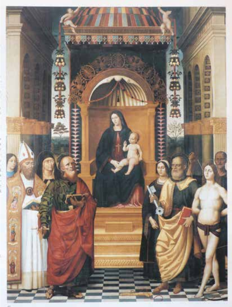
57. Antonio Rimpatta, Pala di San Pietro ad Aram , Napoli, Museo di Capodimonte