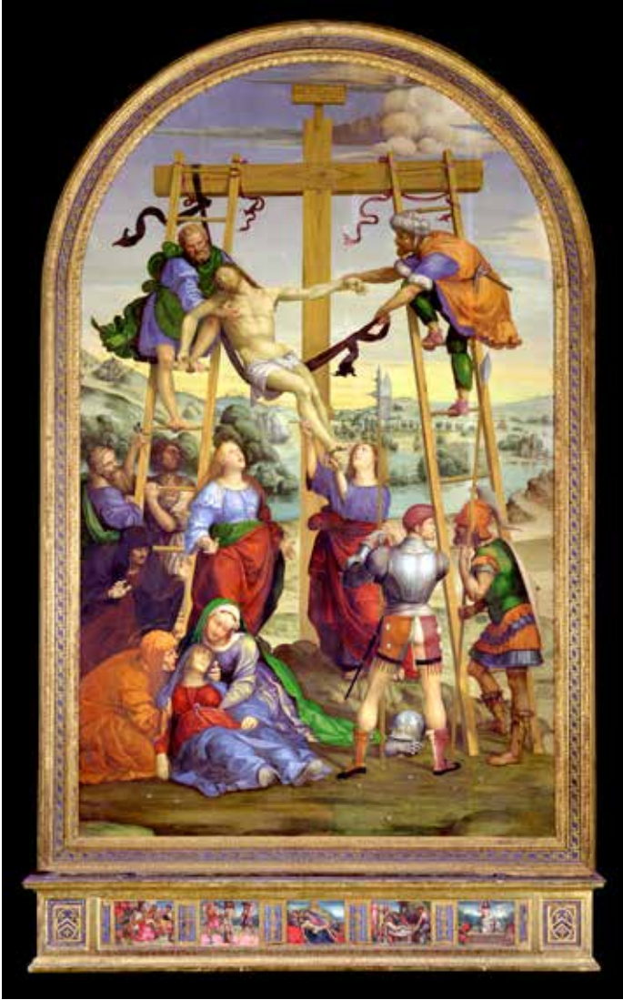
42. Giovanni Antonio Bazzi detto il Sodoma, Deposizione dalla Croce , Siena, Pinacoteca Nazionale