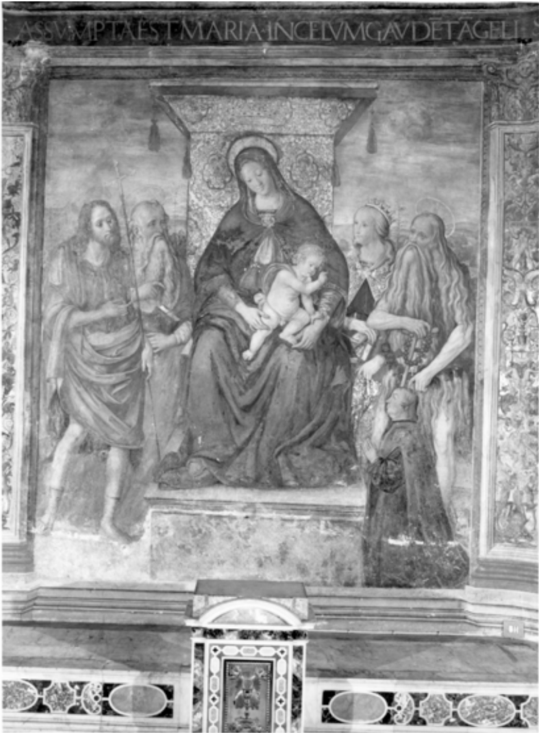
44. Baldassarre Peruzzi e collaboratori, Madonna col Bambino e i santi Giovanni Battista, Girolamo, Caterina d'Alessandria e Onofrio con il donatore , Roma, Chiesa di Sant'Onofrio al Gianicolo